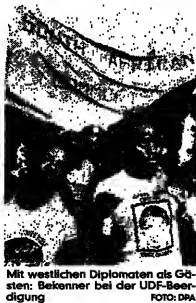
Mit westlichen Diplomaten als Gästen: Gebner bei der UDF-Beerdigung